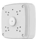
Opcjonalnie dostępny adapter montażowy BCS-AT48